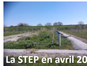
La STEP en avril 2010